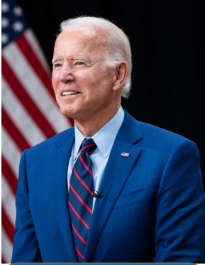
1) prezidenciális köztársaság