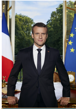
2) félprezidenciális köztársaság