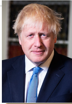
3) parlamentáris kormányforma