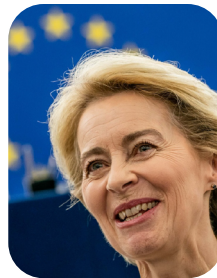
Ursula von der Leyen Az EB elnöke