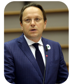
Várhelyi Olivér szomszédosság- és bővítéspolitikáért felelős biztos